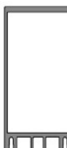
Montante con tapa plana

Atenuación acústica: Puede mantener el valor de atenuación acústica del acristalamiento