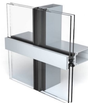
Muro aspecto trama horizontal con junta vertical y piezas puntuales