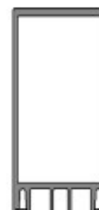
Montante con junta vertical y piezas puntuales