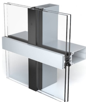
Muro aspecto trama horizontal con tapa plana