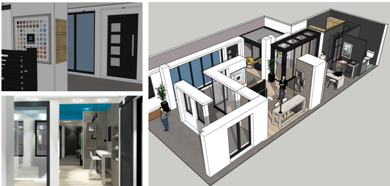
VUES 3D