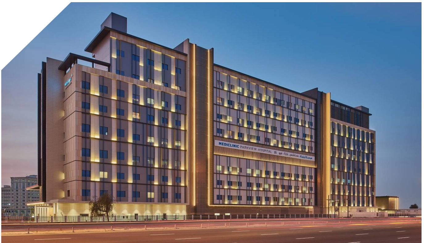
Hôpital Mediclinic Parkview, Dubaï Agence d'architecture : Stantec & Intérieurs Al Shafar (ASI)