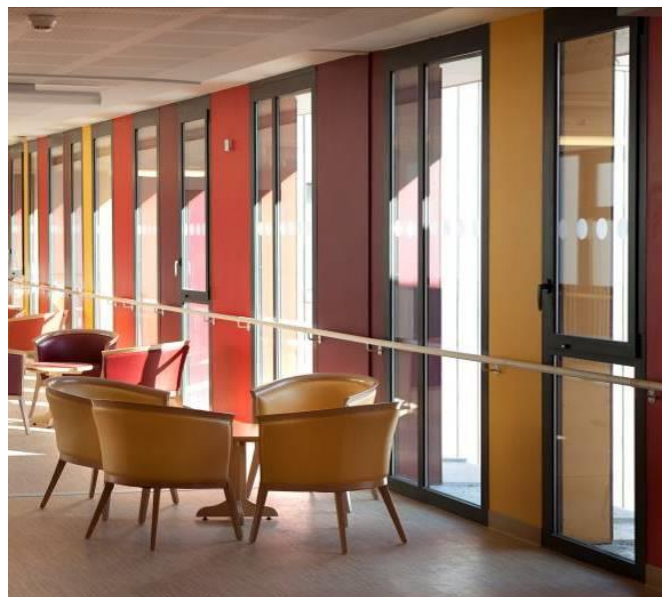
Agences d'architecture : Emergence Architecture & GTBA

Toutes les solutions en aluminium TECHNAL sont adaptées aux attentes spécifiques des personnes âgées en termes de maniabilité, de confort et de sécurité . Dans les chambres, les 80 fenêtres SOLEAL posées sont oscillo-battantes et dotées d'un système anti-défenestration pour une protection optimale. Les salles communes et les bureaux comportent 40 ouvertures à la française pour faciliter l'entretien , tandis que les 12 portes SOLEAL possèdent un seuil plat pour faciliter le passage des résidents à mobilité réduite . Les menuiseries ont également été conçues pour maximiser les apports solaires et limiter la consommation d'énergie.