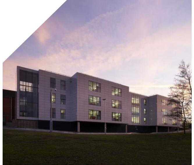
Agence d'architecture : The Manser Practice

L'enjeu était de bâtir un hôpital confortable et accueillant où le bien-être des patients constitue la priorité, sans faire l'impasse sur une architecture contemporaine et élégante. Conçu par le cabinet d'architecture THE MANSER PRACTICE, le Chesterfield Royal Hospital présente une architecture en « T » qui révolutionne la disposition classique des services. Ils disposent de deux ensembles de chambres (trois services de 32 lits) dont les ouvertures ont été créées en murs-rideaux GEODE VEC afin de garantir un apport maximal en lumière naturelle . Le confort des patients est optimal, améliorant l'efficacité de leur rétablissement. Fabriqué et installé par DORTECH ARCHITECTURAL SYSTEMS, chaque ensemble vitré, L. 1,2 x h. 2,4 m, se compose d'une partie fixe et d'un châssis à projection assurant la ventilation en toute sécurité. Le vitrage extérieur collé offre une façade lisse, sans cadre aluminium visible, qui inonde les services de lumière naturelle.