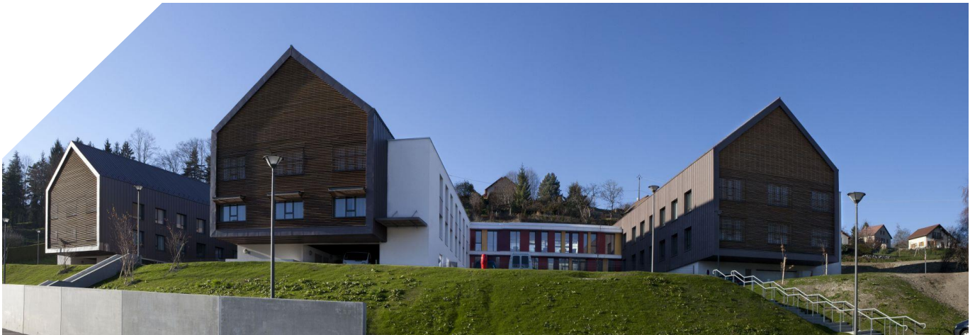
Agences d'architecture : Emergence Architecture & GTBA

Chaque aile révèle une dimension humaine et urbaine du projet. Les toits-terrasses végétalisés prolongent la surface du terrain. Les deux patios proposent un grand nombre d'arbres et de plantes, suivis d'une succession de salles et d'espaces. Ce parti pris architectural, associé aux murs-rideaux GEODE (210 m 2 ), contribue à instaurer un dialogue naturel entre intérieur et extérieur.