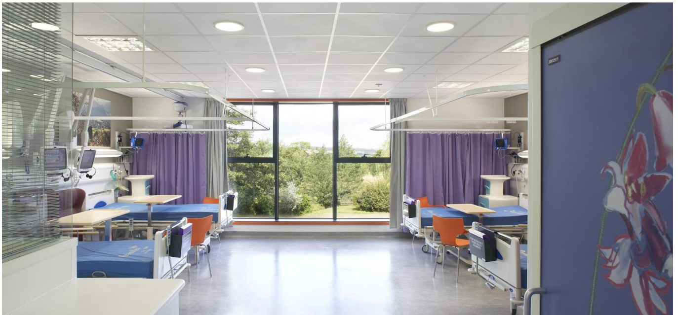
Crédit photo : TECHNAL - Photographe Hufton + Crow Agence d'architecture : The Manser Practice

Le système de murs-rideaux GEODE VEC a également été utilisé pour le vitrage toute hauteur de deux cages d'escaliers et pour les postes d'infirmiers présents à chaque étage. La finition gris anthracite de GEODE VEC et les vitrages à contrôle solaire hautes performances à faible émission contrastent avec le bardage . Le choix du mur-rideau GEODE VEC, et certaines de ses fonctions brevetées, ont contribué à la rapidité de construction, essentielle pour respecter les délais de ce programme ambitieux qui devait ouvrir avant la période hivernale. Les travaux ont duré 52 semaines. Le résultat est un établissement qui se rapproche davantage d'un hôtel que d'un hôpital classique.