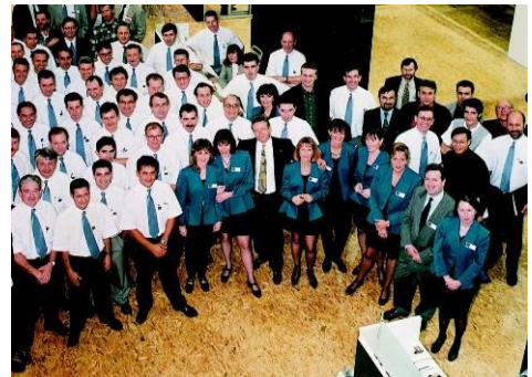
Équipes TECHNAL

Collaborateurs, ALUMINIERS AGRÉÉS TECHNAL, MAISONS DE LUMIÈRE, fabricants... sont de véritables ambassadeurs qui portent la marque avec amour et conviction . Des postes à la production aux commerciaux, en passant par le marketing, la communication ou encore la comptabilité, les équipes sont passionnées. Nombre de collaborateurs ont fait leur carrière dans l'entreprise, environ 35 % ont plus de 20 ans d'ancienneté et 55 % y travaillent depuis plus d'une décennie*. Ils ont à cœur de transmettre leurs savoirs et les valeurs de TECHNAL aux nouveaux talents. L'attachement à la marque se ressent également côté clients. Fidèles, ils partagent une relation forte, parfois transmise de génération en génération .