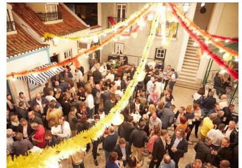
Convention du réseau des Aluminiers Agréés Technal