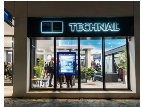
Concession Maisons de Lumière by Technal

En 1981, cette culture du service s'illustre par la création du premier réseau de menuisiers en France baptisé « ALUMINIERS AGRÉÉS TECHNAL » et qui aujourd'hui regroupe 230 membres . L'objectif est de fédérer ses partenaires autour d'une démarche commune pour garantir aux maîtres d'œuvre et d'ouvrage une qualité de fabrication et de pose. Elle se renforce également avec le lancement des espaces MAISONS DE LUMIÈRE en 2007 . Dédiés aux particuliers, ces points de vente leur permettent d'être conseillés par des professionnels et d'élaborer en toute sérénité leurs projets. Depuis début 2020, ils ont évolué en concessions afin d'intensifier le maillage national et répondre ainsi avec réactivité aux attentes du plus grand nombre.