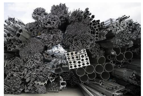
Usine Hydro à Clervaux

L'aluminium rien que l'aluminium ! Faire le choix d'un unique matériau, noble, durable et souple dans ses applications, est une stratégie poussée par le fondateur ANDRÉ BOS et perpétuée au fil des décennies par les dirigeants. Depuis un peu plus d'un an, TECHNAL fournit d'ailleurs à ses clients des profilés aluminium bas carbone Hydro REDUXA 4.0 et Hydro CIRCAL 75R plus respectueux de l'environnement. Le premier est fabriqué à l'aide d'énergie hydro-électrique et possède une empreinte carbone maximum de 4,0 kg de CO 2 e/kg d'aluminium. Le second est constitué d'au moins 75 % d'aluminium recyclé provenant d'anciennes menuiseries et garantit une empreinte carbone de 2,3 kg de CO 2 e/kg d'aluminium. C'est 84 % de moins que la moyenne mondiale pour l'extraction primaire.