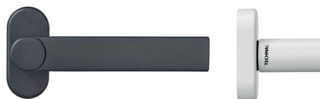
Poignée de porte avec rosette spécifique (33x14mm) (uniquement disponible en version ronde)