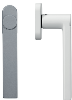
Poignée de fenêtre ronde avec rosette standard

Les poignées SELECTION sont disponibles avec des rosettes de 27x10mm ou 33x14mm en fonction du type et des dimensions de la menuiserie. Une rosette réduite (disponible en 2022) accentuera le style minimaliste.