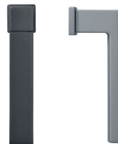
Poignée de fenêtre carrée avec rosette format réduit *